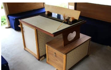
点茶台「八峯卓(はっぽうたく)」