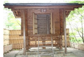
板倉「神坐(かみくら)」